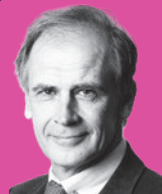
PAUL SEVELDA Präsident Österreichische Krebshilfe