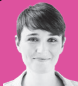
SIGI MAURER Aktivistin gegen Hass im Netz